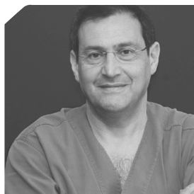
Svolge attività di libero professionista in Bari, occupandosi prevalentemente di chirurgia orale, implantologia e parodontologia.

È autore e coautore di pubblicazioni scientifiche su riviste specialistiche e relatore in corsi e congressi in Italia. È Socio Attivo della Società Italiana di Implantologia Osteointegrata (SIO) dal 2014 e socio della Società Italiana di Parodontologia (SIDP).